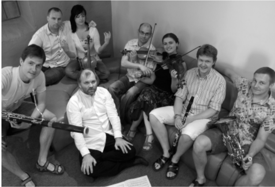
Sinfonietta Riga solistu ansambļis.

Francis Šberts – neliels bri ains puisis, l ksmu m zikas un v na vakaru baud t js, uzticams draugs saviem daudzajiem draugiem, m lest bas alkstošs romanti is neveiksmnieks, neticami raž gs komponists, sava laika kompoz cijas margin lis, tom r visnota nijs, kam labi paz stama kr slain robeža starp prieku un skumj m – šaj zon dz vojoties, Šberts rad ja neticami vieglu un vienlaikus bezdiben gi dzi u m ziku, ko var apbr not un m l t.