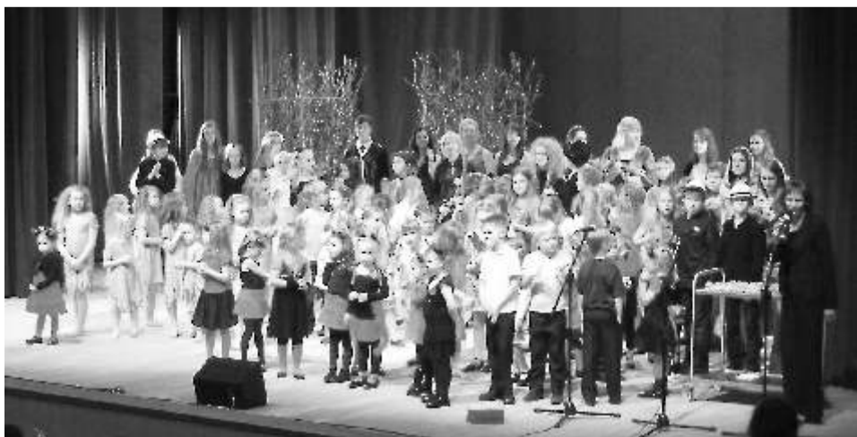
Ogres Mazais te tris un vok l studija Svīlpastes p s koncertuzveduma “Spr d tis” pirmizr des.